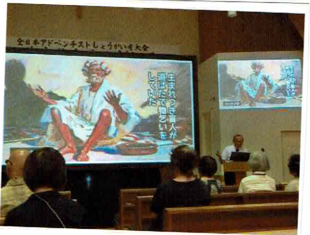
緑にかこまれたすがで美しい教会